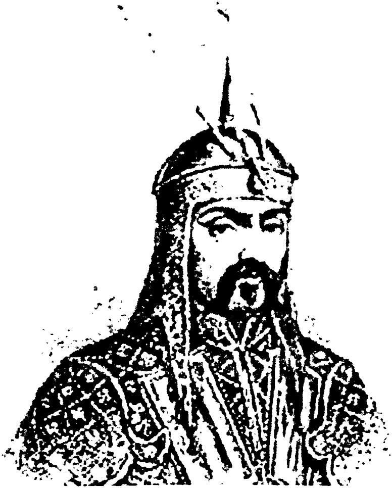
جنكيز خان مؤسس الإمبراطورية المغولية