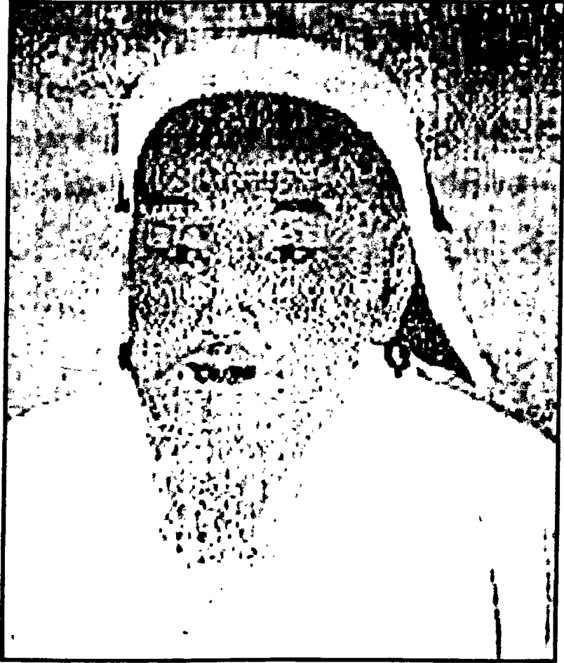
جنكيز خان مؤسس الإمبراطورية المغولية