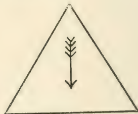
Fig. 2. Die Familien in den sozial oberen Schichten pflanzen sich stärker fort als in den unteren. Nächste Folge: Der soziale Abstieg überwiegt den sozialen Aufstieg. Weitere Folge: Zunahme der Durchschnittsbegabung der Bevölkerung.

Der durch die Überfüllung der gebildeten Berufe hervorgerufene Geburtenrückgang betraf unmittelbar natürlich nur die