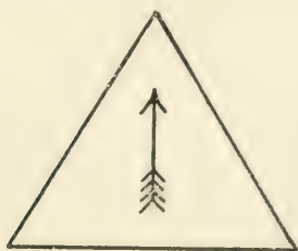
Fig. 1. Die Familien in den sozial oberen Schichten pflanzen sich geringer fort als in den unteren. Nächste Folge: Der soziale Aufstieg überwiegt den sozialen Abstieg. Weitere Folge: Abnahme der Durchschnittsbegabung der Bevölkerung.

In eigentümlicher Verblendung glaubte man in dauerndem gesellschaftlichen Aufstieg zugleich einen dauernden Aufstieg der Kultur und der Rasse zu sehen. In Wirklichkeit ist das Gegenteil der Fall. Dauerndes gesellschaftliches Aufsteigen ist ohne Aussterben an der Spitze gar nicht möglich. Wir wollen uns einmal die soziale Gliederung in grober Annäherung als Pyramide mit breiter Basis und spitzem Gipfel dargestellt denken. Wenn nun die Resultante der sozialen Auslese für den Durchschnitt der Bevölkerung ein sozialer Aufstieg ist, wie ihn der von unten nach oben gerichtete Pfeil in Fig. 1 darstellt, so ist das selbstverständlich nur möglich, wenn in den oberen Schichten dauernd zahlreiche Familien aussterben, um aufsteigenden Platz zu machen. Diese Richtung der Bevölkerungserneuerung wird fast ganz allgemein als die „normale“ angesehen, obwohl sie auf die Dauer mit Sicherheit zur Verpöbelung der Rasse und zum Verfall der Kultur führt. Wenn dagegen in den oberen Schichten die Kinderzahl größer wäre als in den unteren, so würde die Richtung der Bevölkerungserneuerung notwendig von oben nach unten gehen, wie es Fig. 2 zeigt, und die Begabung der Bevölkerung würde zunehmen.